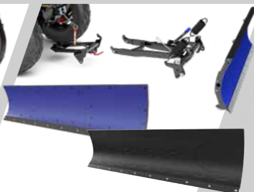
Système de lame à neige